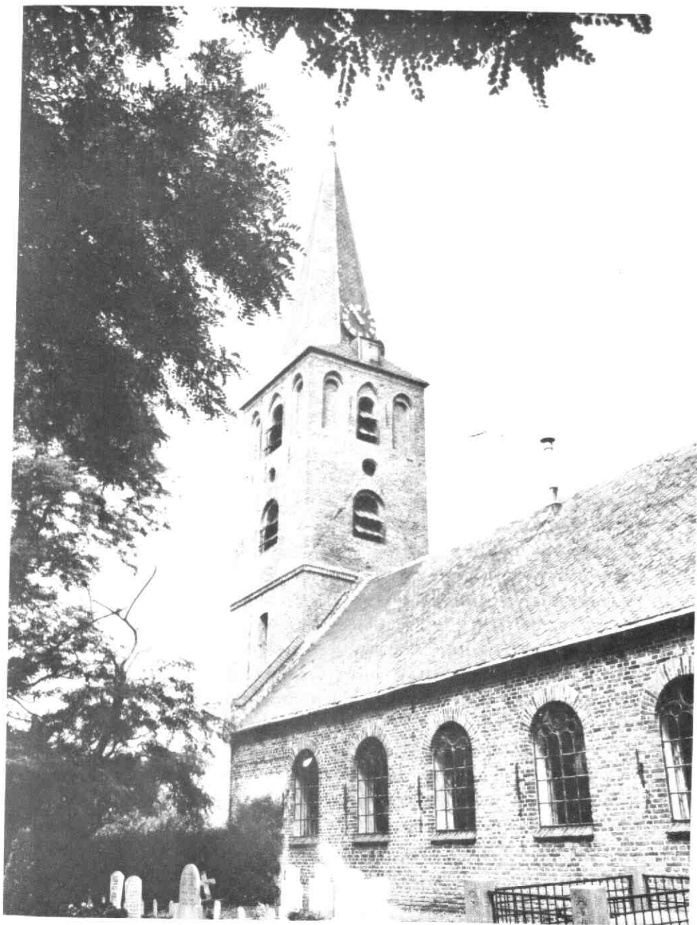
Gezicht op de N.H. kerk te Schalkwijk met gerestaureerde gemeentetoren en 13,5 meter hoge spits.