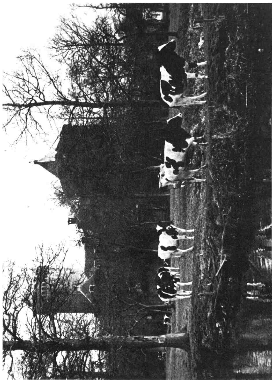
Kasteel Sterkenburg voorjaar 1971.