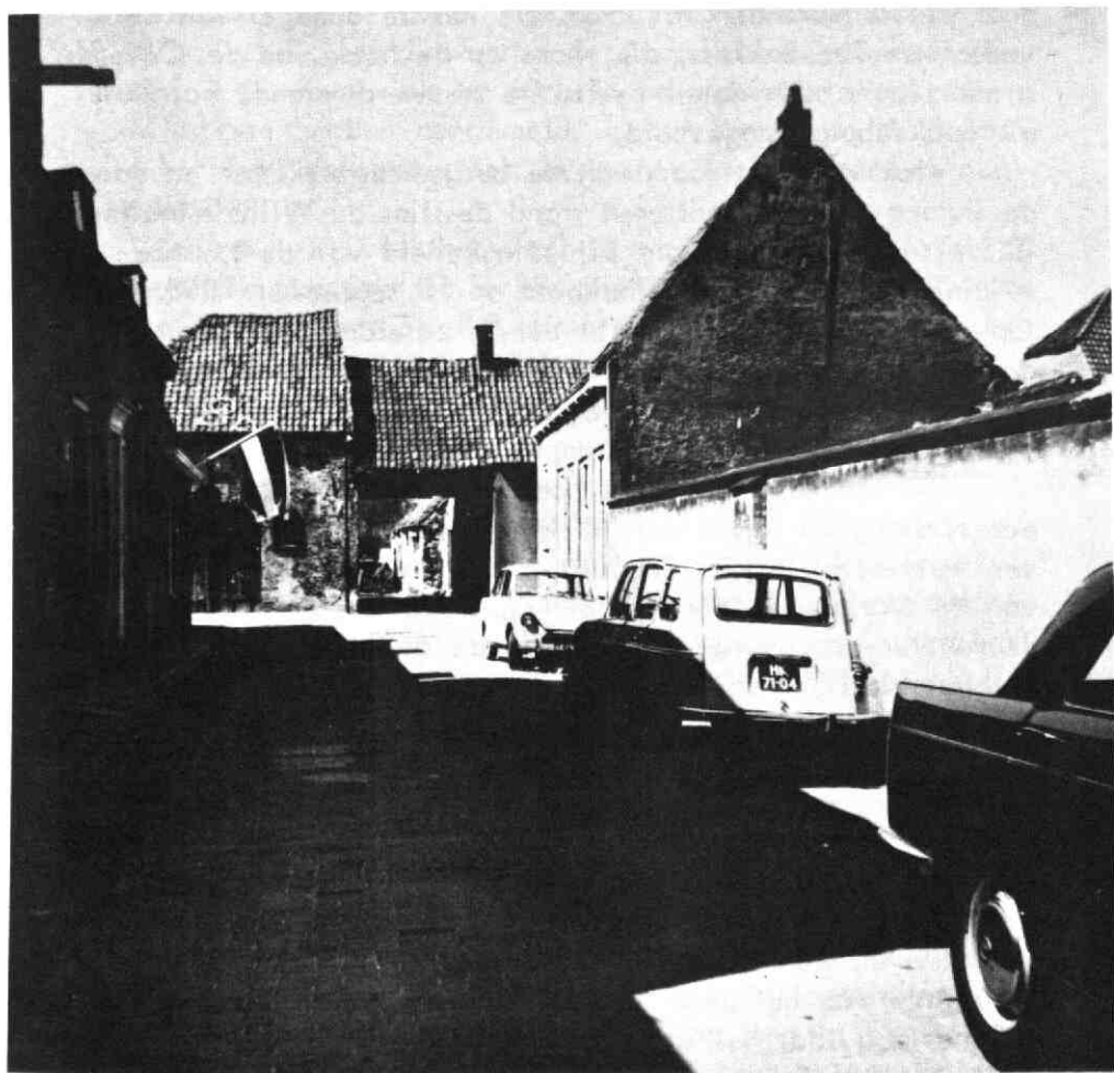
De oude poort in de Achterstraat, welke eertijds leidde naar de toren "Kostverloren" (afgebroken in 1966). Rechts Maleborduurstraat 2 (afgebroken in 1969).