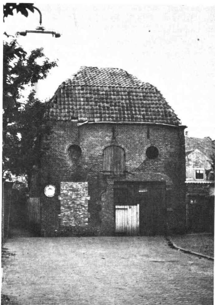
De voormalige mandenmakerij in de Mazijk. Zal ze voor definitieve ondergang worden behoeft?