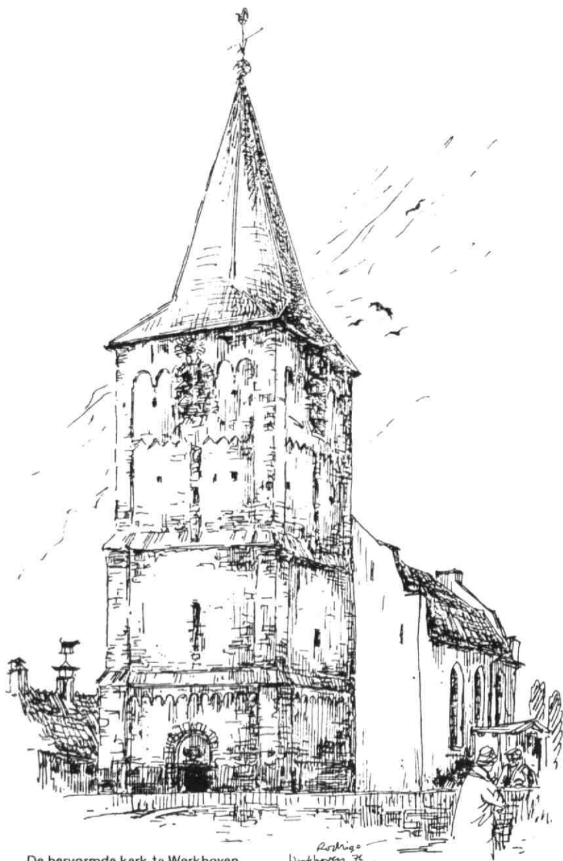
De hervormde kerk te Werkhoven