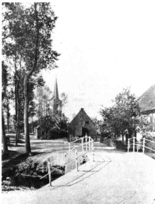
Foto van de Brink te Schalkwijk uit het begin van deze eeuw.

Een platte lage brug met leuning met daar achter in alle rust de Brink zelf. Keren wij terug naar onze eeuw dan zien wij de Brink zoals velen hem nog herinneren uit hun jeugdijaren. Over de brug zien we de smidse en daar achter het vertrouwde beeld van de Hervormde Kerk.