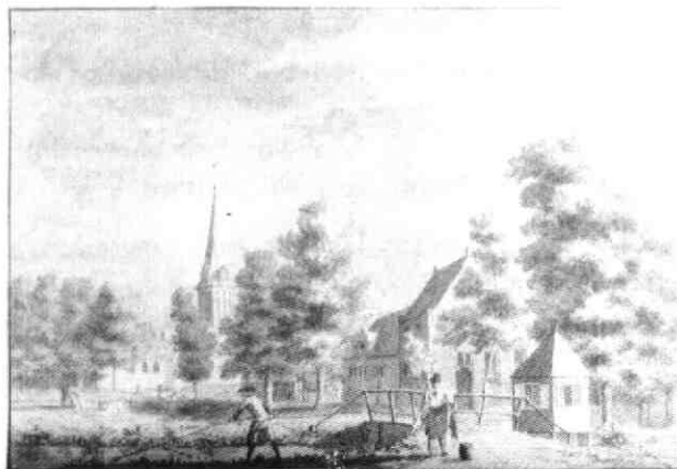
Tekening in O.l.-inkt naar Pront door L.P. Serrurier. R.A.U., topogr. atlas nr. 949

Bij het bestuderen van een plattegrond in het Bezittingenboek van Oud-Munster blz. 94/95 R.A.U. 933 gedateerd 1620 bleek mij, dat zich toen reeds een brug voor de toenmalige Brink bevond. Ik neem aan dat deze brug van hout gemaakt was. Helaas is dat niet duidelijk waar te nemen. Een andere prent van Schalkwijk laat de hedendaagse Provincialeweg zien. Links bevindt zich een stevige stenen brug waarin een steen met de datum 1626. In de verte zien we de (houten ?) brug voor de Brink liggen. De brug uit 1626 is in 1888 vervangen door een nieuwe. Ook die datum, gehouwen in steen, is nog terug te vinden. Een fraaie getekende prent van de Brink en de Herv. Kerk laat nu duidelijk zien hoe de brug er uit zag vòòr 1849.