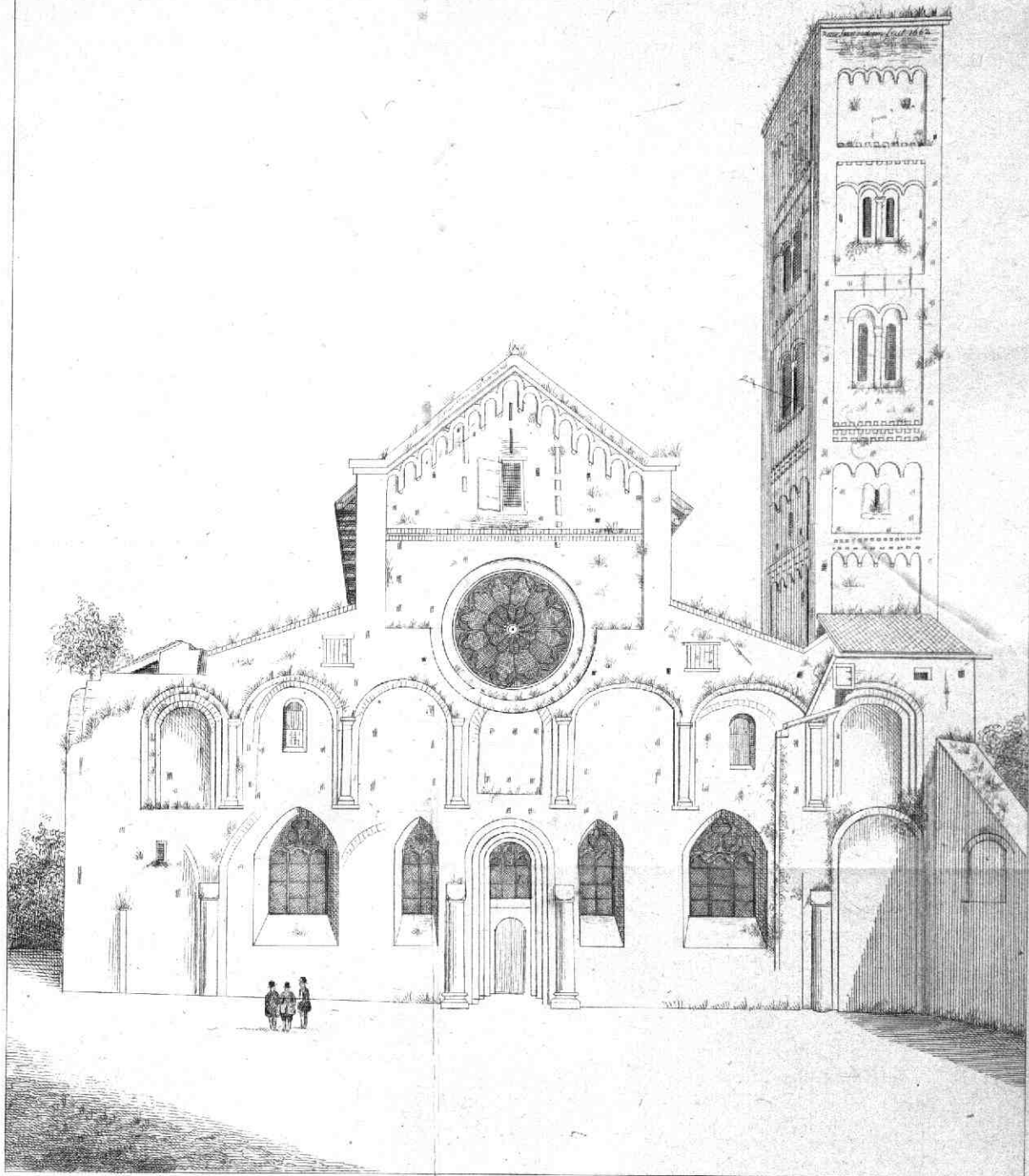
Pieter Saenredam pinx. 1662