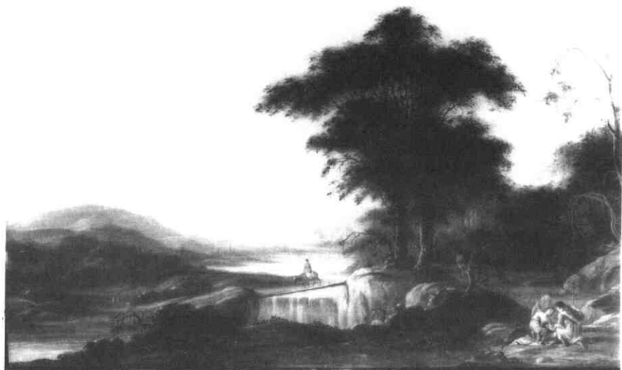
Afb. 8. B. (Dirck Jansz.?) Admiraal, Mythologische voorstelling in een landschap, paneel, 37,5 x 50 cm. Veiling New York, Christie's, 23 maart 1984, nr 81.

Amsterdam, en in 1984 nogmaals in New York een schilderij geveild dat hierbij wordt afgebeeld (afb. 8). Het is een onduidelijke mythologische voorstelling in een landschap en is goed voorstelbaar als Utrechts werk uit de tweede helft van de zeventiende eeuw. Hoewel ik hierover geen zekerheid kan verschaffen, wil ik de hypothese poneren dat dit een werk van Dirck Jansz. Admiraal is.