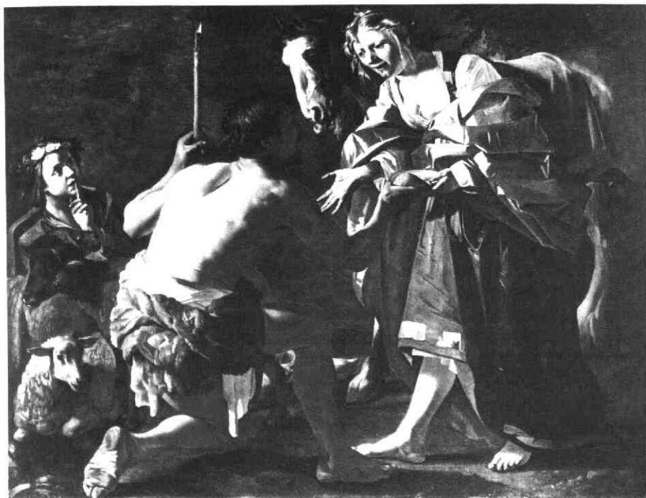
Afb. 5. Dirck van Baburen, Granida en Daifilo , gedat. 1623. Particuliere collectie.