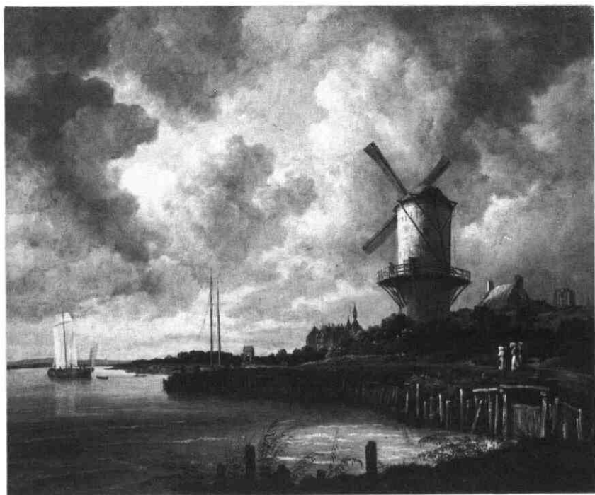
Afb. 6. Jacob van Ruisdael, De molen bij Wijk bij Duurstede .