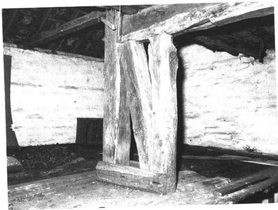
Foto van een onderdeel van de zeventiende-eeuwse houtskeletconstructie van het pand Brink 7 uit oktober 1980, vóór de restauratie

(Th. J.A. Vernooij; Atlas gemeente Cothen)