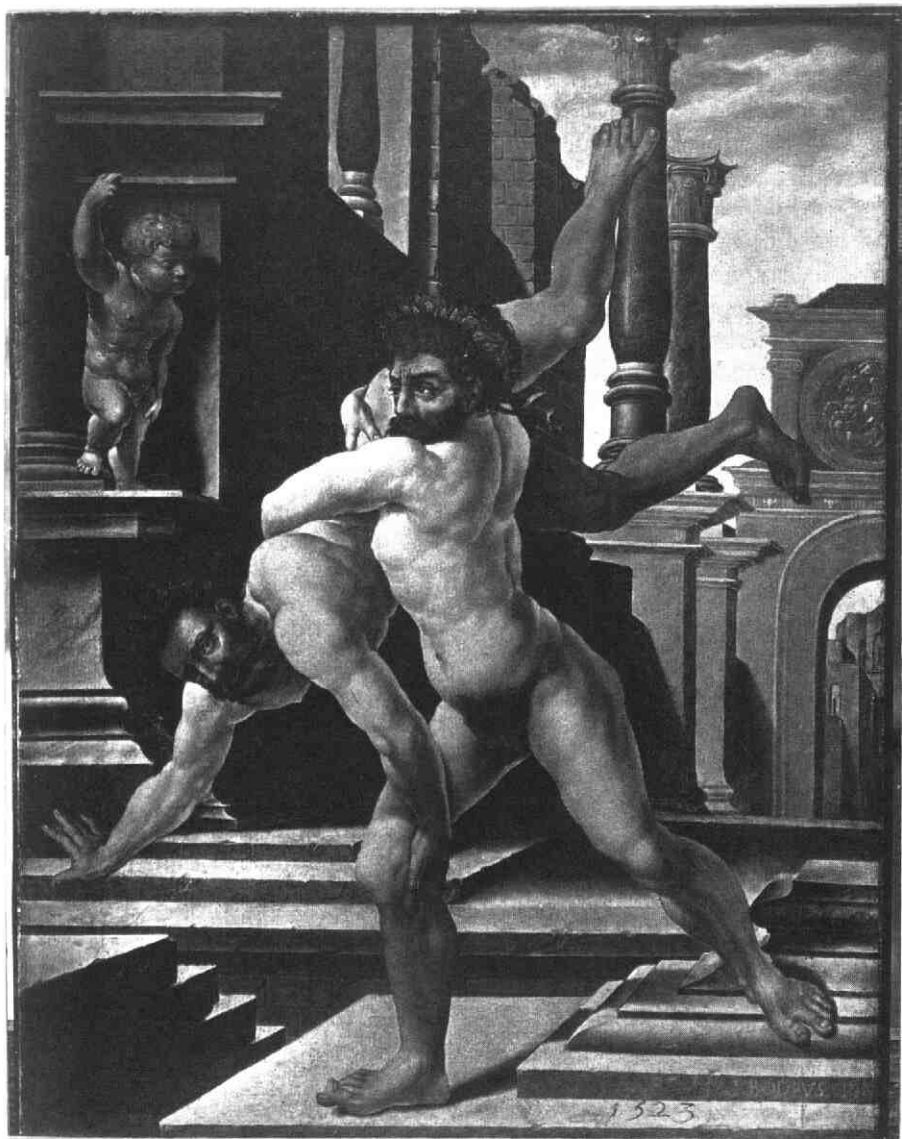
Afb. 1. Kopie naar Jan Gossaert van Mabuse, Hercules en Antaeus, gedateerd 1523. Particuliere collectie.