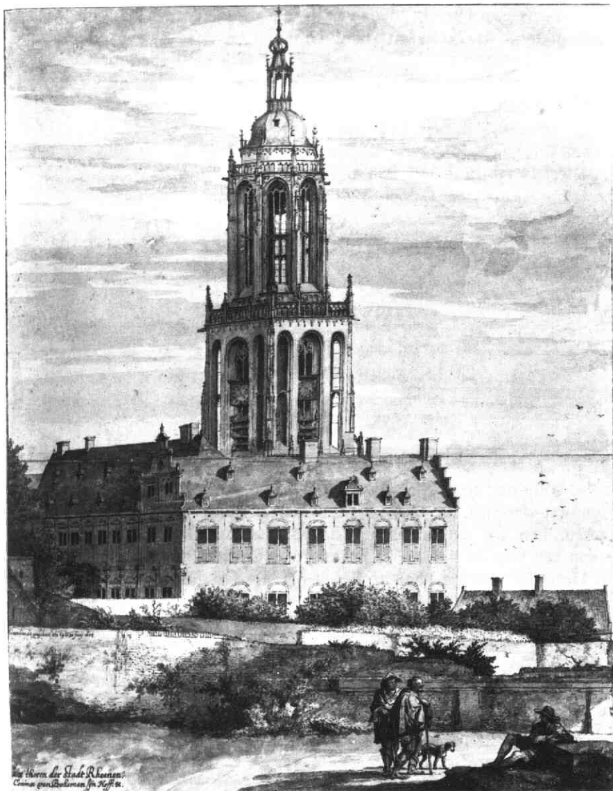
Afb. 3. Pieter Saenredam, Toren van de Cunerakerk en het Koningshuis te Rhenen, Amsterdam, Rijksprentenkabinet.