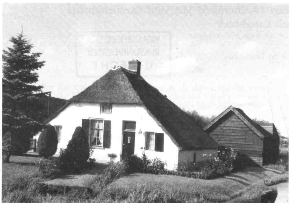
De boerderij aan de Langbroekerdijk A 42