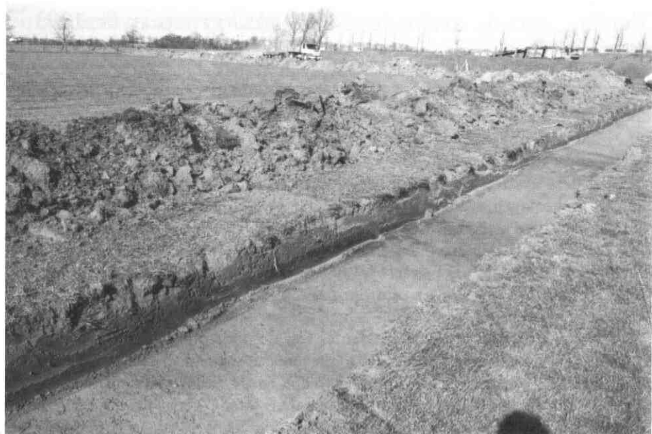
Proefsleuf van de ROB op het nieuwe bedrijventerrein Het Rondeel in Houten, waarbij bewoningssporen uit de Romeinse tijd werden gevonden