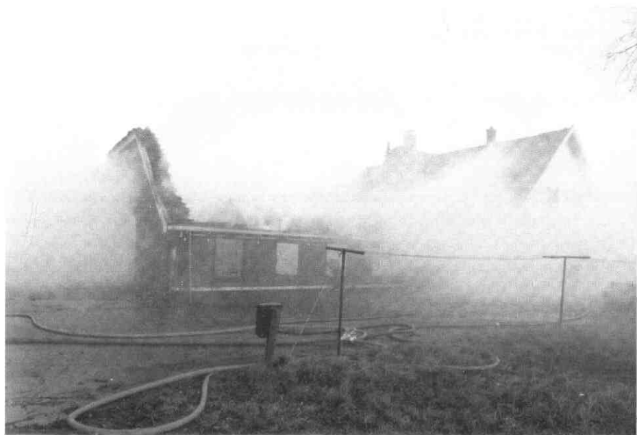
Brand op de boerderij Rijsbrug.