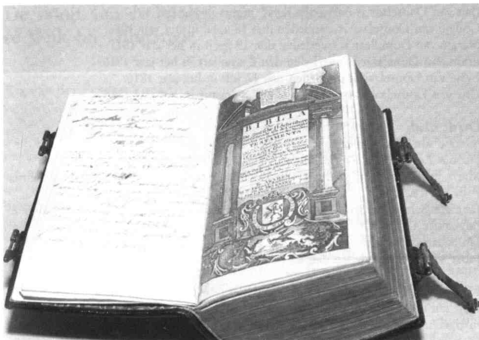
Het bijbeltje geopend op de titelpagina met links een deel van de familieaantekeningen (foto auteur, 1992)

In het bijbeltje noteerde Baatje in haar eigen handschrift de volgende familie gebeurtenissen: