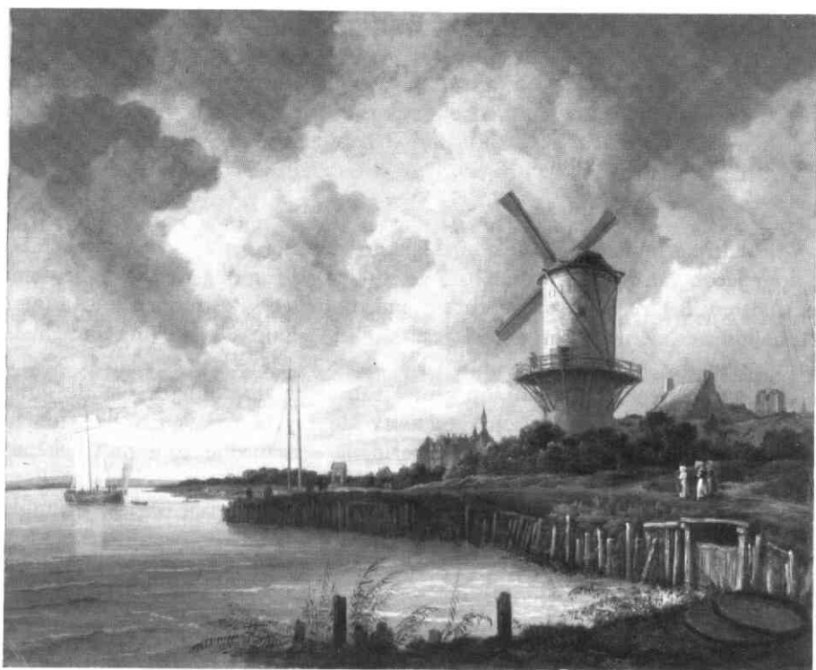
Het beroemde schilderij 'De molen bij Wijk bij Duurstede' door Jacob van Ruisdael ca 1675 (origineel Rijksmuseum Amsterdam).

niet lang met het afbreken van de molen hebben gewacht. Heel wat minder voortvarend was hij evenwel met het opruimen van het puin. In april 1821 maakte de raad van zijn afwezigheid gebruik om hem aan te laten zeggen het bij de muurtoren (waarop de molen had gestaan) achtergebleven puin en de stenen, zo spoedig mogelijk op te ruimen en de in ruïneuze staat verkerende toren ofwel eveneens te slopen ofwel te herstellen 5 . Erg gezeeggelijk was Van Wijk niet. Pas eind 1823 koos hij, na herhaalde aanzeggingen en onder dreiging van een rechtszaak, eieren voor zijn geld en ging ertoe over om de restanten van de zo