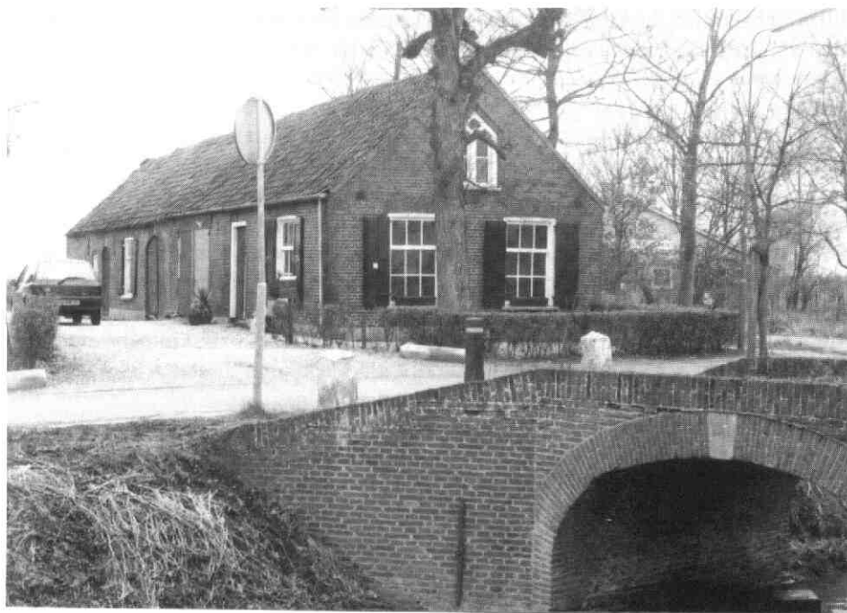
Het nieuwe onderkomen van de stichting, het voormalige bak-zomerhuis aan het Overeind 39 in Schalkwijk (1994)

Tijdens de dijkverzwaring van een aantal jaren geleden werden de restanten aangetroffen van de reeds enige eeuwen geleden verdwenen boerderij Het Kraaienkamp te 'tull en 't Waal. Een mooie opgraving was voorts een zestiende-eeuwse steenoven te 'tull en 't Waal. Ondertussen werden er ook veel akkers belopen, waarbij het een en ander werd gevonden. De meeste werkgroepleden zijn lid geworden van de Archeologische Werkgemeenschap Nederland (AWN). Helaas is het nooit gekomen tot het bijwonen van een zomerwerkkamp. Hoe nuttig dit blijkt te zijn is wel bewezen in de persoon van Noël Staakman die er de nodige ervaring opdeed. Hij kwam uit Zoetermeer (waar hij opgravingen meemaakte), ging wonen in Wijk bij Duurstede en komt nu regelmatig naar Schalkwijk. Hij maakt onder andere dagrapporten en beschrijft de vondsten. Veel hulp krijgt hij van Nelleke Bogaard die onder meer scherven wast en nummert. Tevens zoekt zij de documentatie over het voorwerp op.