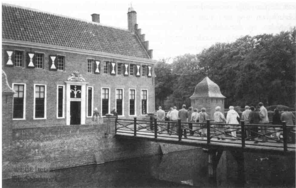
Grote excursie naar de Menkemaborg met een aantal deelnemers op de brug. (foto H.J.J. Steenman, 1993.)

in de giethal van de voormalige klokkengieterij werd het gebruik van klokken in Nederland rond 1960 getoond, zowel in de stad als op het platteland. Aansluitend was er een film waarbij men zag hoe klokken gegoten werden in deze zelfde hal. Sinds 1863 maakte het fabrikantengeslacht Van Bergen volgens eeuwenoude tradities klokken voor velerlei doeleinden. Dit wereldberoemde bedrijf, dat in 1980 haar poorten sloot, maakte niet alleen luidklokken, carillons, beiaarden en scheepsbellen, maar ook brandspuiten. Het klokgieten in de getoonde film en de in de gietkuil aanwezige modellen in diverse stadia gaven een inspirerend beeld van dit oude ambacht.