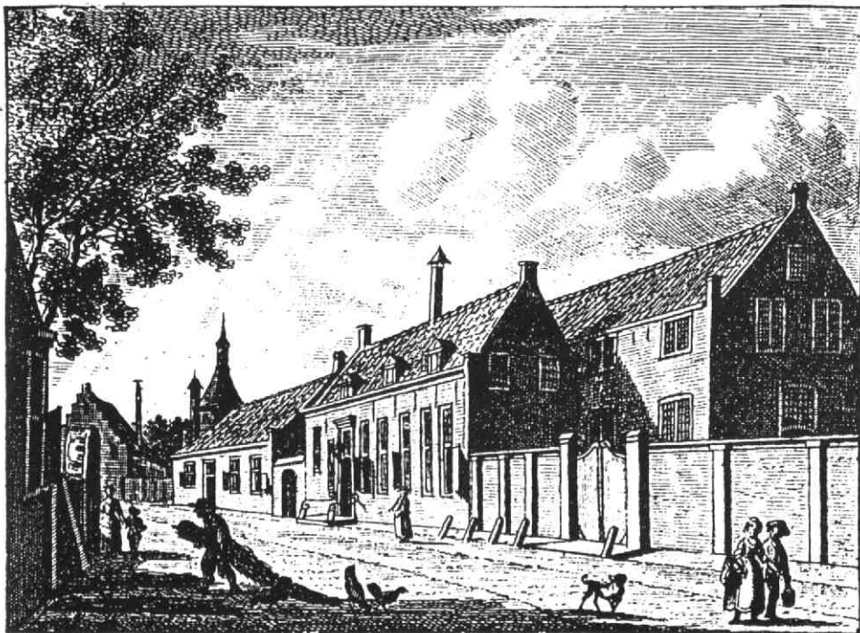
De rooms-katholieke schuilkerk in de Achterstraat (kopergravure uit 1788 van K.F. Bendorp naar een tekening door J. Bulthuis, Atlas Gemeentearchief Wijk bij Duurstede)

Melkweg woonde en er vier morgen land bezat 16 . De Van Bemmels aan de Melkweg vormen een hoofdstuk op zich.