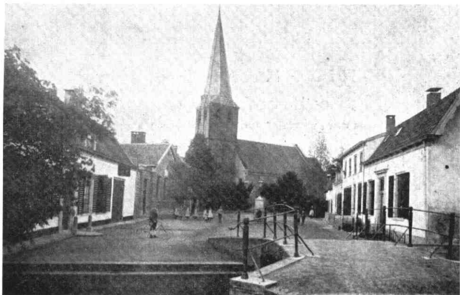
De Brink in Nederlangbroek met een fietser (Prentbriefkaart ca 1900)

de daders op te sporen'. Er werd daardoor driftig op de verboden wegen gefietst. Besloten werd om nieuwe bordjes te plaatsen 8 .