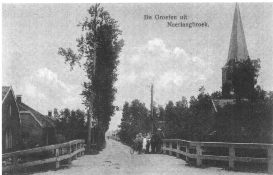
De nog onverharde en smalle Doornseweg gezien vanaf het kruispunt met de Langbroekerdijk (Prentbriefkaart uit 1918, Particuliere Collectie C. van Leeuwen)

gefietst, werd het request van Van der Poorten aangehouden 6 .