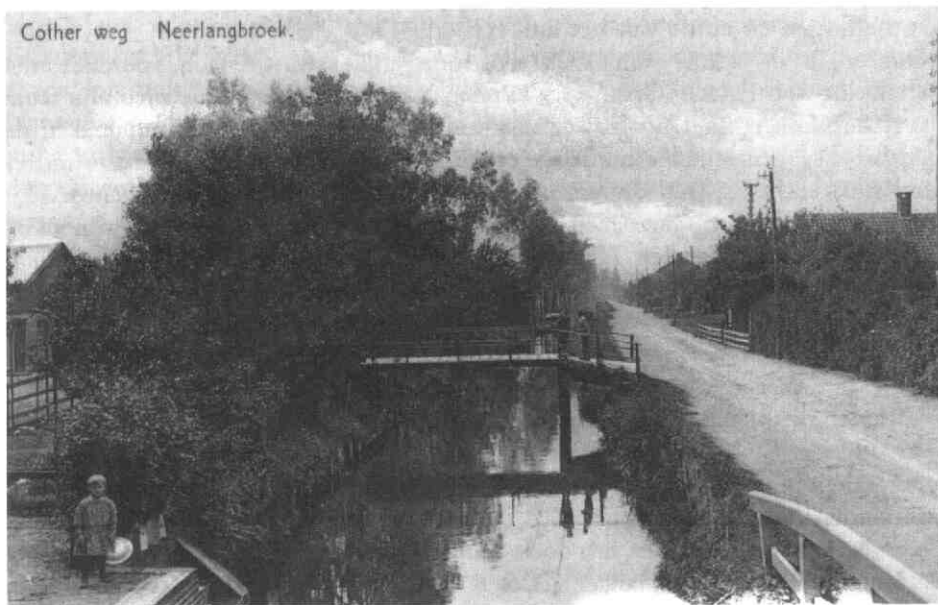
De Cothorweg kort voor de verbreding en verlegging van de Cothergrift in 1939