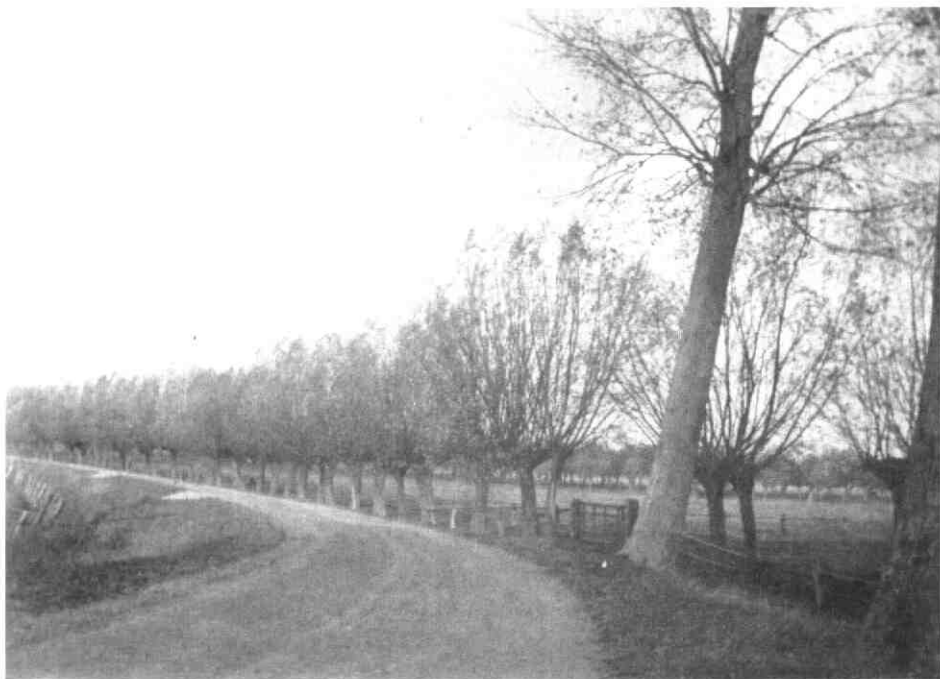
De bocht in de Wijkersloot vlakbij de Vogelpoel rond 1900