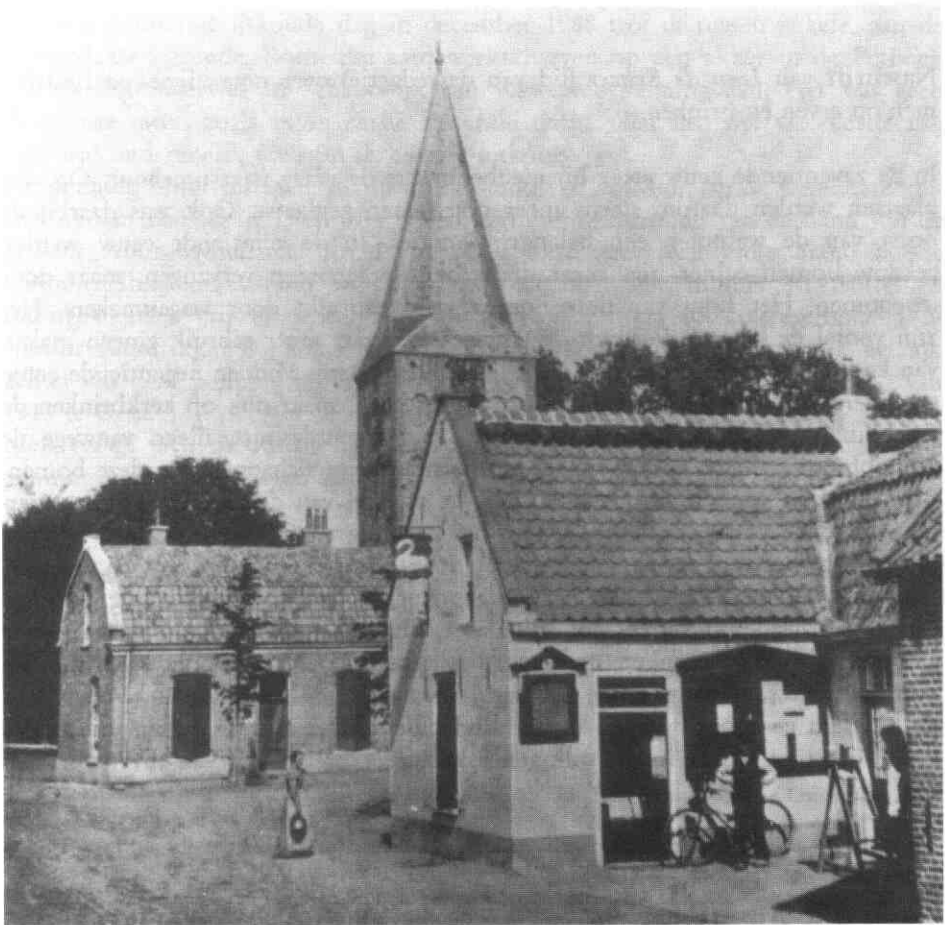
Een deel van de Brink op de hoek van de Herenstraat, omstreeks 1900. Van één van de pas geplante lindebomen is de boombeschermer vagelijk zichtbaar. Op de voorgrond in het midden: herberg De Zwaan