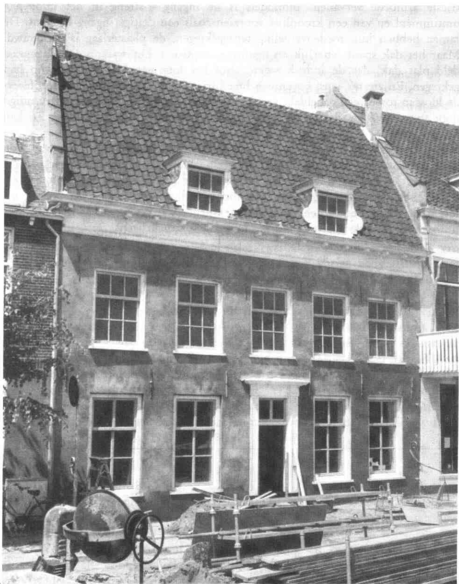
Het huis Dijkstraat 3 dat tijdens de restauratie in de zomer van 1994 zijn dak terugkreeg