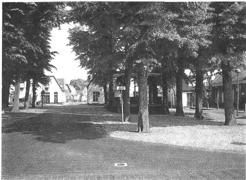
De Brink in Werkhoven, gezien vanaf de Herenstraat

(dia: Marijke Donkersloot-de Vrij, juli 1994)