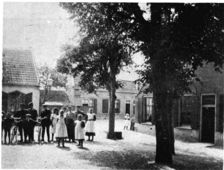
Houten - Brink - rond de eeuwwisseling en tegenwoordig.