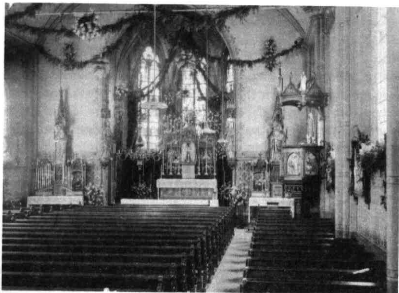
Het interieur van de Barbarakerk.

Het in 1845 geschonken altaar werd bij de verbouwing in 1885 vervangen door een stenen altaar met hardstenen trappen en een ijzeren tabernakel. Bovendien kwam er aan weerszijden van het hoofdaltaar een bijaltaartje, de een gewijd aan Maria en de ander aan Jozef. Eén en ander werd ontworpen door H. van der Geld, die als beeldhouwer werkzaam was op het atelier van de architect Hezemans.