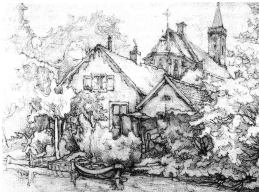
Gezicht op de kosterwoning van de R.K. kerk te Bunnik vanaf de Kromme Rijn gezien. Op de achtergrond de kerk. Potloodtekening door Johannes de Kruif + 1935 (R.A. Utrecht, Top. Atl., coll. de Kruif no. 20)